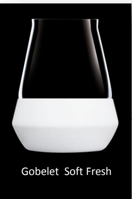
Gobelet Soft Fresh

INNOVATION FRAICHEUR dédiée aux vins frais (vins rosés, blancs et effervescents).