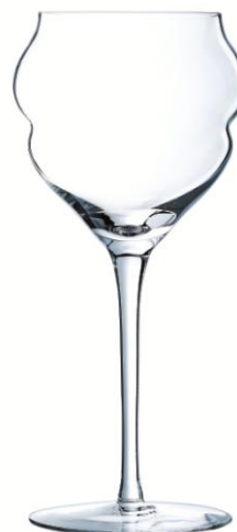
Coupe 30cl 1011428P