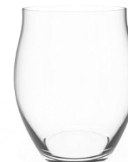
Gobelet 40cl 1011651